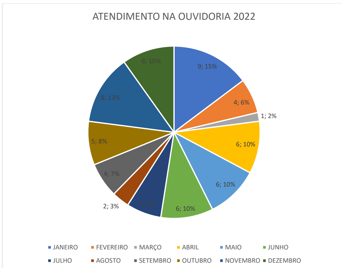
Gráfico 1: Distribuição em porcentagem das manifestações por período de atendimento.

Em relação ao período que mais houve manifestações dos usuários foi no mês de janeiro, correspondendo a 9,15%, seguindo de novembro com 8,13% e empatados com 6,10% os meses de abril, maio, junho e dezembro.